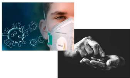
Teatro financiero sacudirá la economía, luego de Covid 19