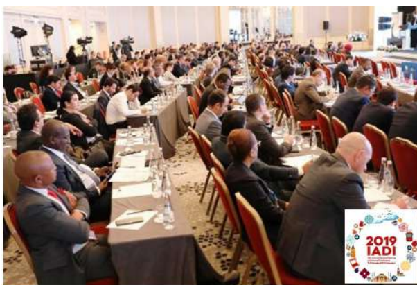
Conferencia anual IADI 2019 Estambul, Turquía